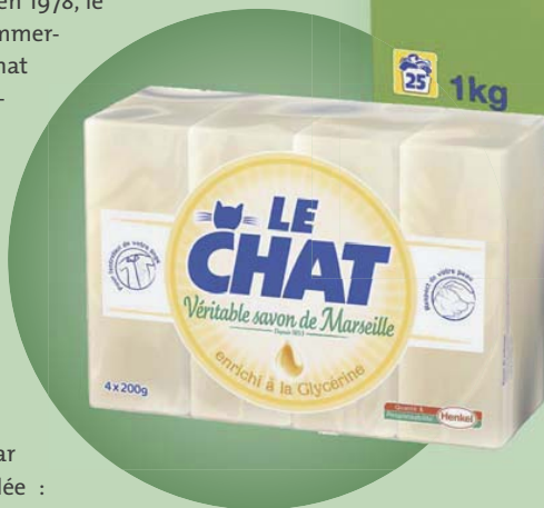
Piliers de la marque dans les années 1960.

L'Union Générale des Savonneries (UGS) devient le premier fabricant de savon de Marseille et développe une stratégie de gamme autour de la marque Le Chat. La marque étend son offre avec le lancement du savon Le Chat à la glycérine (1975) et surtout, après plusieurs années de recherche, entre dans un nouveau territoire : la lessive, avec Le Chat Machine (1981)