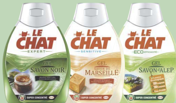
Retour aux sources.

Chat et sont déclinés pour les trois gammes : Le Chat Expert Gel Savon Noir, Le Chat Sensitive Gel Savon de Marseille et Le Chat Eco Efficacité Gel Savon d'Alep. « Le Chat entend se présenter comme une marque simple qui montre son efficacité et son authenticité », explique Sébastien Chauve. D'où le retour à une mise en avant des ingrédients : bicarbonate ou savon noir allié à la fleur d'oranger pour Expert (vert), savon de Marseille pour Sensitive, savon d'Alep pour Eco efficacité. La publicité se fait l'écho de ce retour à la simplicité et à l'authenticité : « depuis toujours et sous toutes ses formes, on utilise le savon noir, un produit naturel, aux vertus nettoyantes et désincrustantes légendaires, Le Chat les transforme aujourd'hui en une nouvelle forme de lessive ».