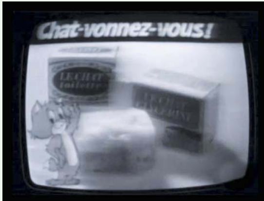
"Chat-vonnez-vous !" 1969

deux-guerres, les savonneries sont concurrencées par des entreprises de fabrication de poudres à laver, puis de détergents liquides. Faute d'entente et de mécanisation, de nombreuses savonneries provençales ferment. Au sortir de la Seconde Guerre mondiale, la société Ferrier fusionne avec la société Fournier au sein des Nouvelles Savonneries françaises. En 1953, la marque peut alors revendiquer son antériorité et son efficacité, avec la campagne publicitaire « La marque centenaire qui garantit la qualité : Le Chat ». Elle étend son offre en 1959 en proposant des savons aux marques Ambre et Ambre BB. Le savon Le Chat devient, en 1969, savon glycéринé et savon de toilette. Une des premières publicités (agence BBDO) met en scène, en juin de la même année, un chat animé et parlant : « doux comme un lait de beauté, chavonnez-vous », conseille-t-il. En 1970, trois statues s'animent à travers trois films, grâce à la magie de Le Chat F 24 : « F 24 à mousse déodorant, vous habille de fraîcheur pendant des heures et des heures ». En 1971, la même agence promeut Le Chat F24 au « déobactil », « le savon déodorant à la crème de beauté ». L'année suivante, le Petit Chat devient Le Chat Toilette.