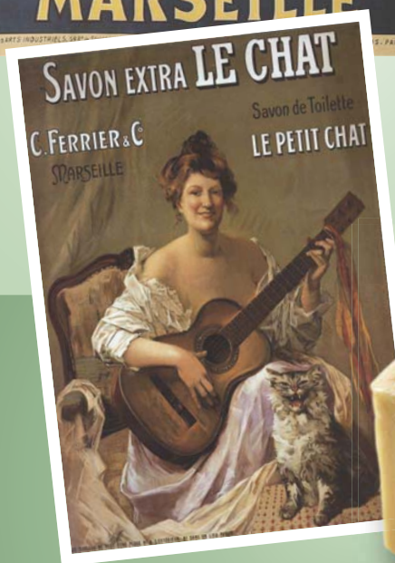
Premières réclames des années 1900.