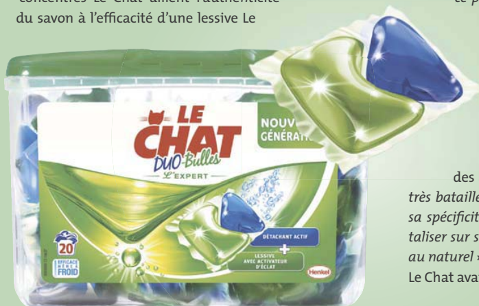
Une nouvelle rupture.

2012 : la plate-forme de marque, jusqu'alors plate-forme monde gérée en Allemagne, est dorénavant gérée localement pour répondre aux attentes spécifiques des consommateurs de chaque pays ainsi qu'à l'histoire de la marque Le Chat en France. Le Chat complète sa gamme Sensitive avec Le Chat Sensitive 0 %, sans parfum, sans colorants et sans conservateurs, certifiée ECARF, Centre Européen pour la fondation de recherche sur les allergies. La même année, les gels superconcentrés Le Chat allient l'authenticité du savon à l'efficacité d'une lessive Le