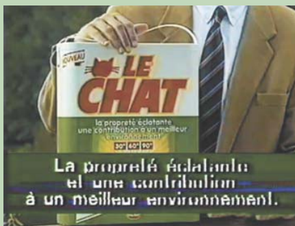
"Chat alors" 1985