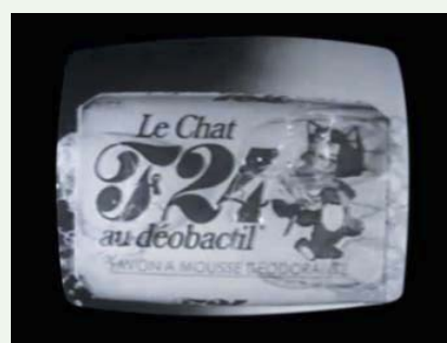
"Le Chat F24" 1971