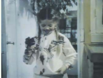
"Chat alors" 1985