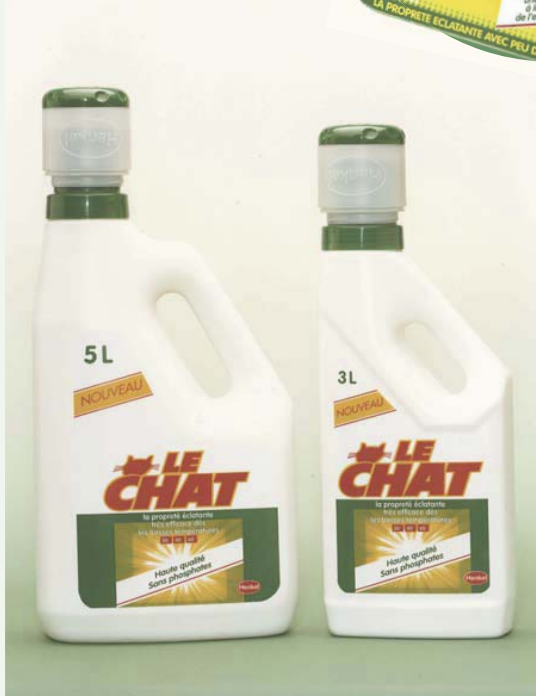
Après la poudre, Le Chat liquide sans phosphates en 1991.